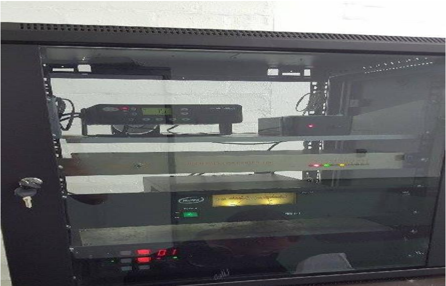
145.625 herhaler, 70 cm skakel, herhaler- beheer-eenheid