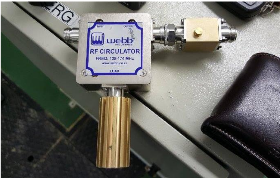
"Circulator" - die eenheid dwing RF uitset in 'n fop las indien 'n slegte / hoë swr in die voerlyn/ antenna sou ontstaan. Hierdie eenheid is ook aangebring.